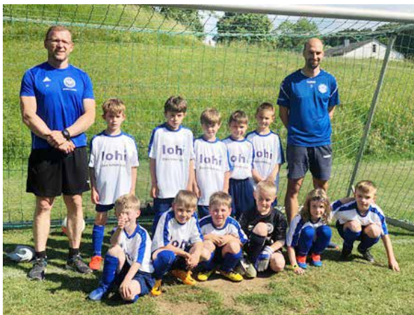
U8 mit ihrem Trainerteam

In den letzten beiden Saisonspielen zeigte sich dann, welches Potenzial wirklich in der Mannschaft steckt, wenn sie eifrig trainiert und als Team auftritt. Mithilfe einer geordneten Abwehrarbeit und schön anzusehenden Spielzügen konnten der TSC Zeuzleben II 10:0 und Türkiyemspor Schweinfurt 11:2 besiegt werden.