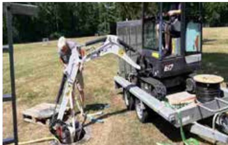
Bild: Tauschen der Pumpe

Zu allem Überfluss gab während der großen Hitze- und Trockenperiode unsere Druckpumpe ihren Geist auf. Unser bereits ausgetrockneter Rasenplatz litt dadurch nochmal erheblich. Nicht nur der Platz, auch die Vereinskasse.