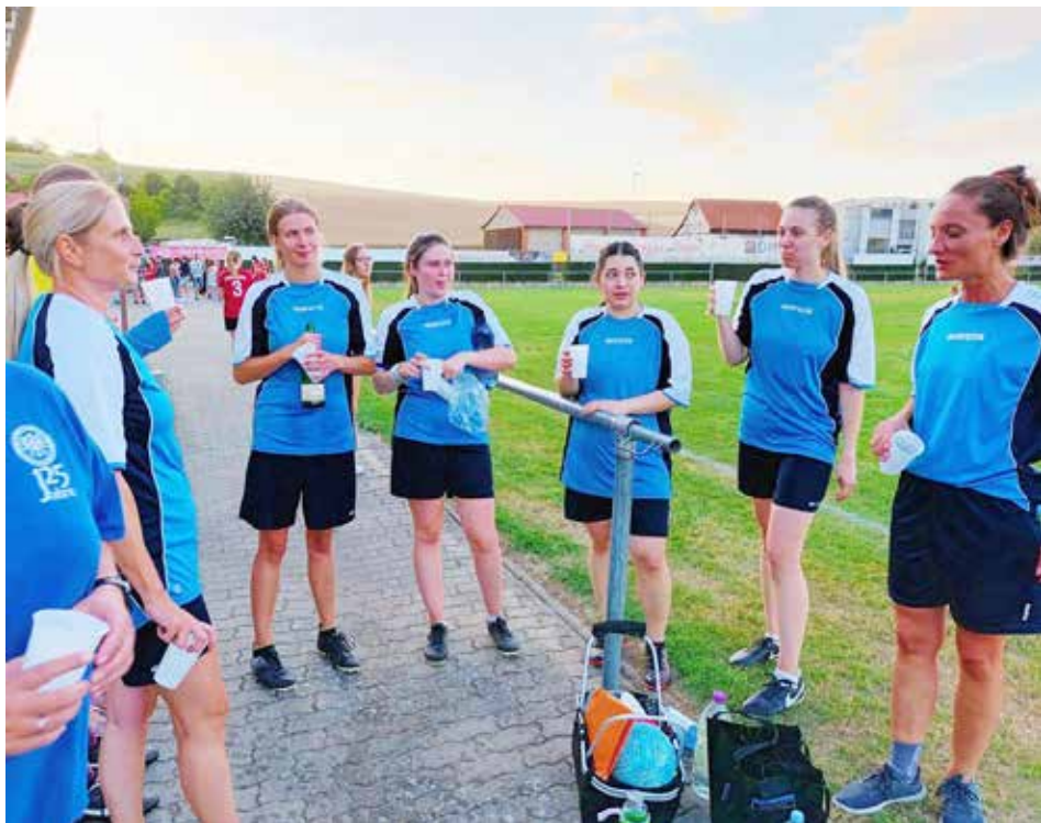
Die Frauenmannschaft direkt nach dem Gewinn der Meisterschaft am letzten Spieltag

zwar nicht vergeben, den Aufstieg in die höchste Kreisklasse A konnten wir aber dennoch feiern. Besonders nach der langen Korbballpause und den vielen Einschränkungen ein sehr schöner Erfolg.