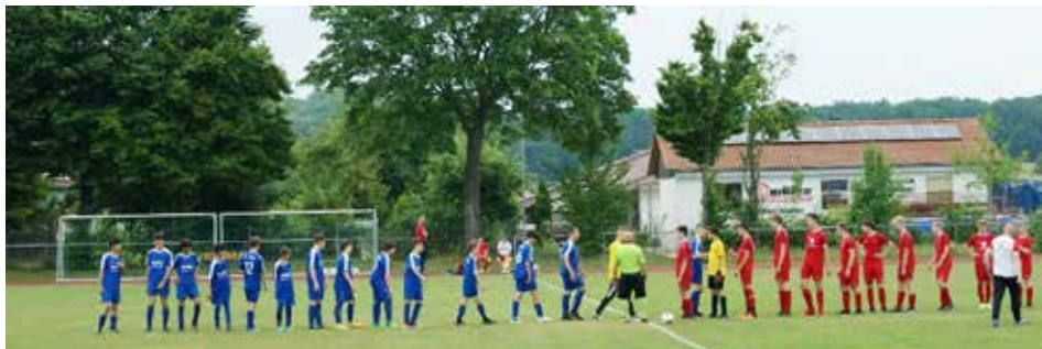
U15 vor dem Spiel gegen die Dreieberg Kickers

Nach einer knapp verpassten Meisterschaft in der letzten Saison starteten wir in die Rückrunde in der stärksten Gruppe. Für die Jungs war das eine große Herausforderung, da sie sich zum Teil gegen zwei Jahre ältere und körperlich überlegene Spieler behaupten mussten. Nichtsdestotrotz steht die Mannschaft auf dem dritten Platz der Tabelle - punktgleich mit dem Ersten und Zweiten. Die letzten drei Spiele entscheiden, ob wir Meister werden oder den zweiten bzw. dritten Tabellenplatz belegen. Egal wie die Saison endet, das Trainerteam, die Eltern und vor allem die Jungs selber, können sehr stolz auf die Leistung sein, die sie vollbracht haben. Nächste Saison werden wir zwei Klassen höher spielen. Die Trainer sind fest davon überzeugt, dass sich die Jungs auch in der Kreisliga etablieren können.