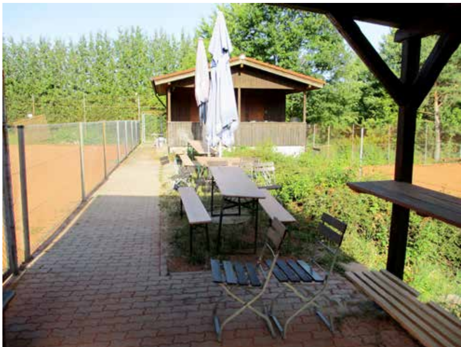
Unsere gemütliche Tennishütte, die von unseren Gästen sehr gelobt wird.