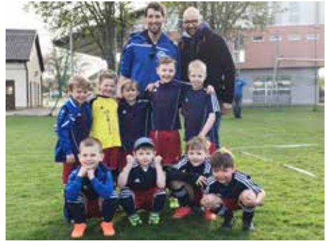
U7 vor dem Spiel in Grafenheinfeld