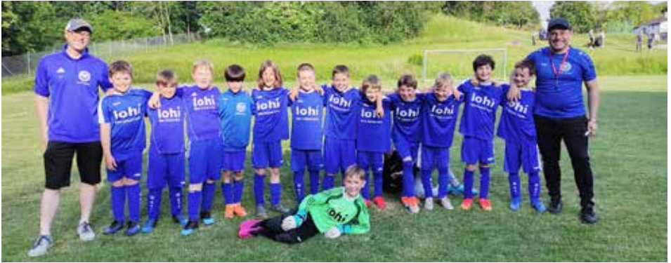
U9 vor dem Heimspiel gegen Poppenhausen

schaften bei einem Minifußballturnier in Geldersheim an, bei der der 1. und 3. Platz durch unsere Teams erzielt wurden. Den Eltern kommt zum Schluss noch ein besonderer Dank zu - die