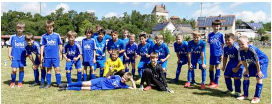
U11 Mannschaftsbild Bild TV Jahn

möchten wir uns bei allen Spielern, Eltern, Helfern und Unterstützern bedanken! Nur durch euren Einsatz können wir die Trainingseinheiten und Spiele so bestreiten. Da das letzte Spiel bereits gespielt ist, lassen wir die Saison noch mit Turnieren und einen Saisonabschluss ausklingen. Ende der Sommerferien wird es dann wieder weiter gehen, damit wir uns auf die nächsten Spiele vorbereiten können. Somit nochmals vielen Dank an alle und schöne Ferien. Erholt euch gut und bis bald!