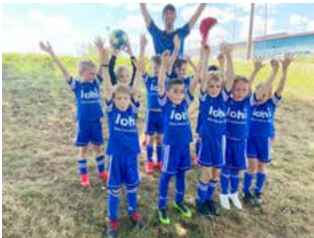
U7 in Siegerpose

12 Teams auf 6 Feldern bei uns am Jahnplatz. Das bestplatzierte unserer 4 Teams wurde hierbei stolzer Zweiter! Nach zwei deutlichen Siegen in Freundschaftsspielen gegen Niederwerrn und Brebersdorf stand dann der erste Verbandsspieltag an, an dem die Kids leider ihre Spiele knapp verloren. Der Begeisterung mit der alle bei der Sache sind, tat das aber keinen Abbruch. Zum Saisonabschluss gab es nochmal einen großen Spieltag in Hassfurt bei dem die Kinder all ihre vier Spiele gewinnen konnten und wirklich super zusammen spielten. So kann es weitergehen.