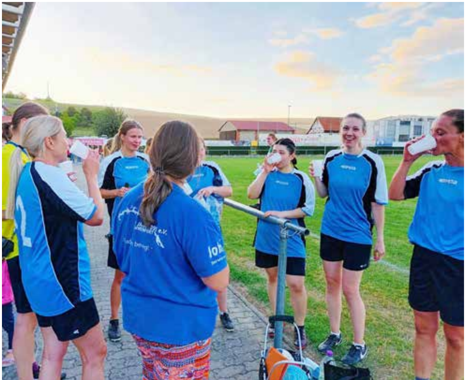
Die Frauenmannschaft direkt nach dem Gewinn der Meisterschaft am letzten Spieltag

Die dann noch ausstehenden 3 Spiele konnten alle gewonnen werden, so dass wir in der Abschlusstabelle mit 5 Siegen aus 5 Spielen ganz oben standen. Ein offizieller Meistertitel wurde